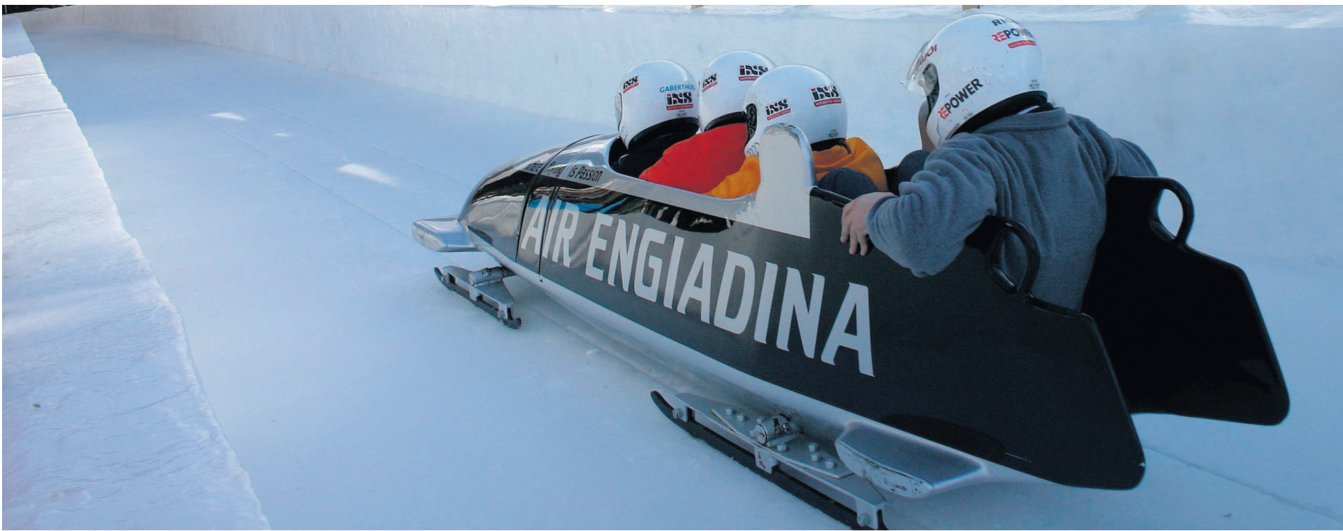
Det tager cirka 70 sekunder at komme ned af den olympiske bobslædebane, der har været den samme i over hundrede år. Selv om de forskellige kurver har navne som »slangekurven«, »solsiden« og »telefonhjørnet«, når man ikke at nyde udsigten.

Schweiz. Det var briterne, som var medvirkende til, at St. Moritz i 1864 blev verdens første skisportssted – og også at den olympiske bobslædebane blev bygget her nogle årtier senere. Rejseliv tog en rask tur, der fik adrenalinen til at rulle.